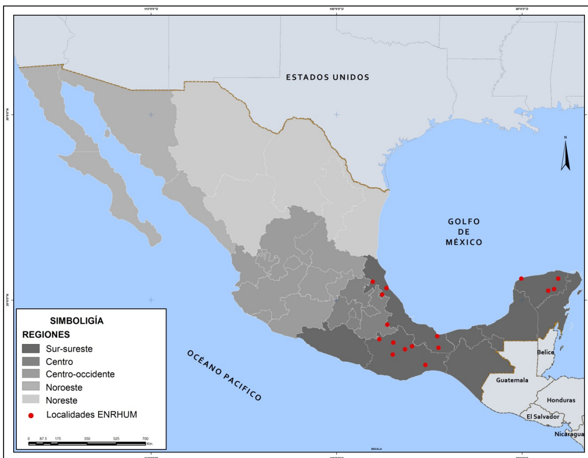
FIGURA I. COMUNIDADES INCLUIDAS EN LA MUESTRA

En este capítulo se utiliza únicamente información para la región Sur-sureste. La Figura I muestra la localización de las comunidades seleccionadas en dicha región. En el cuestionario del 2007 se hicieron una serie de modificaciones que permiten captar de mejor forma el ingreso por concepto de aprovechamiento de recursos naturales. Es por esto que en la mayor parte del análisis presentado en este capítulo se usa la información del 2007. La Tabla I presenta la definición de las variables usadas a lo largo de este capítulo así como el valor promedio que dichas variables toman para la muestra analizada. La información utilizada está a nivel del hogar, es decir, por cada hogar se cuenta con una observación para cada uno de los años. El ingreso que se utiliza es ingreso per-cápita.